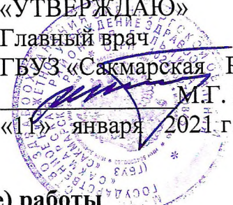
График (расписание) работы комиссий, специалистов и диагностических служб оказывающие платные медицинские услуги